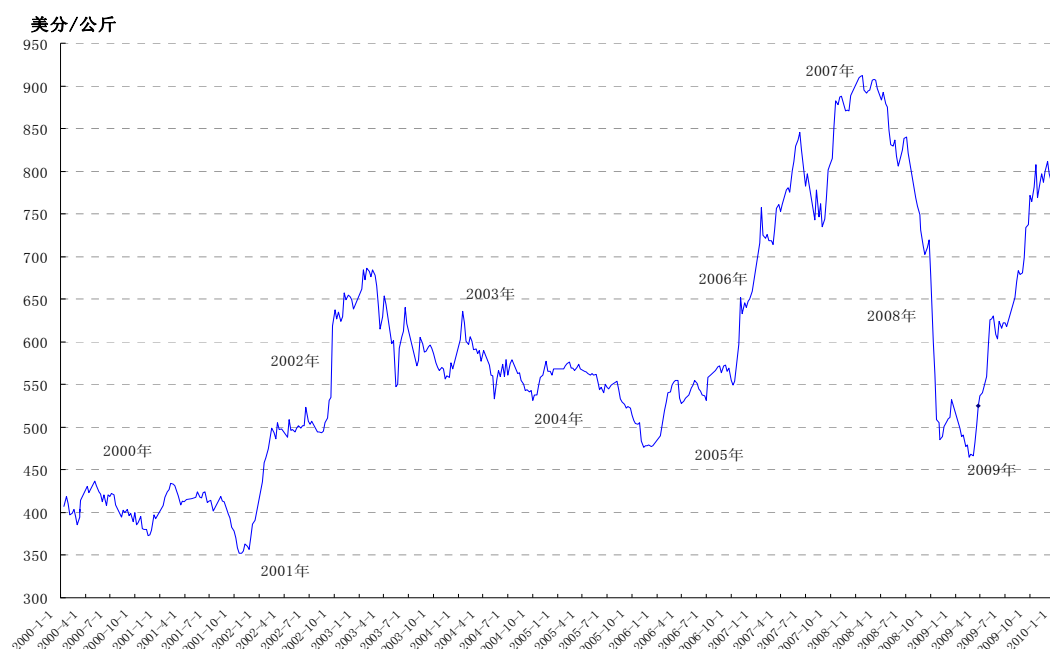
图1 2000年-2009年澳洲东部羊毛拍卖市场指数美金价走势

12月份的3次羊毛拍卖分别在悉尼、墨尔本、弗里曼特尔拍卖市场举行。羊毛供应量约为139495包，成交了128130包，未成交率8.1%。购买羊毛的前五名买家是：(澳)ABB羊毛公司购买18568包；(澳)泰克羊毛公司购买14320包；昆士兰棉花公司购买11629包；福克斯利羊毛公司购买9594包；A. S. GEDGE (AUST)公司购买了7458包。从品种成交价看，本月涨幅较大的主要是我国常用的T54、T55、T56、T58套毛，和该细度范围的边款毛。