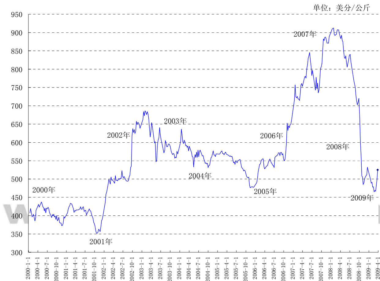
2000/01-08/09 年度澳洲东部羊毛拍卖市场指数美金价走势