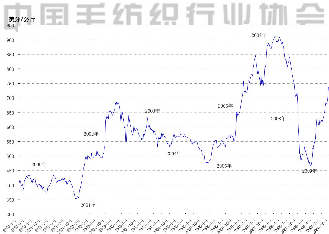
图1 2000/01-09年9月澳洲东部羊毛拍卖市场指数美金价走势

澳元兑美元汇率从9月1日汇价0.8283一直上升到30日0.8846。高汇率的震荡上行，将澳毛在国际市场上的美金价节节推高。9月30日指数美金价最终收于753美分/公斤，比8月底上升74美分/公斤，涨幅10.85%。比08年同期也上升了4.6%；比09年初开盘价上升了51%。（见图1）